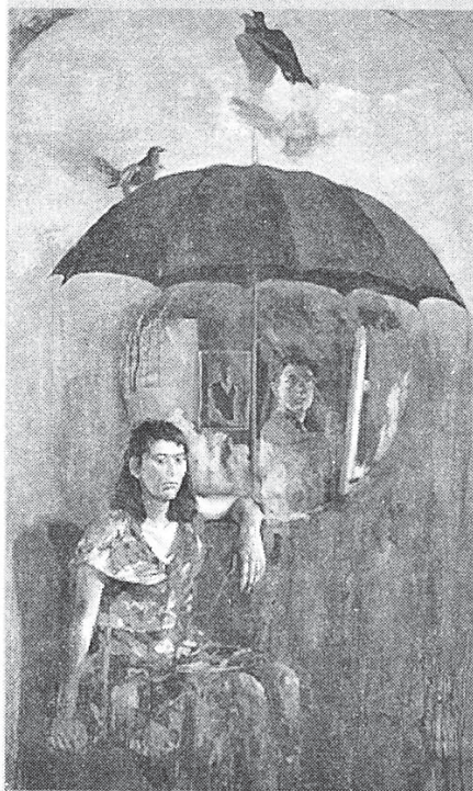
εξώφυλλο: Κ. ΜΑΡΚΟΠΟΥΛΟΣ, «Αποκάλυψη», 1991, λάδι σε καμβά, 200x120 εκ.